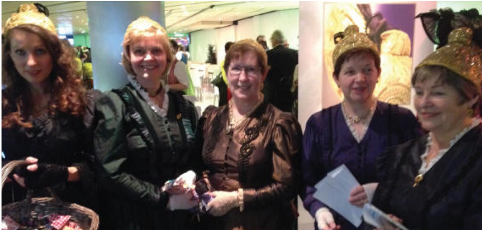
Damenspenden von den Frauen der Goldhaubengruppe