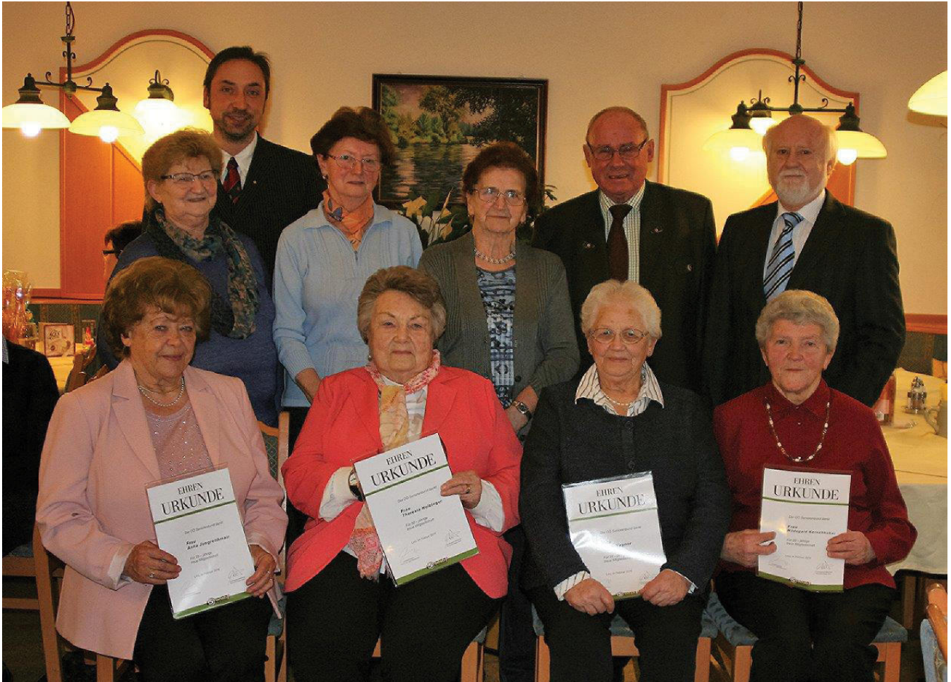
Bei der Seniorenbund Jahreshauptversammlung wurden Ehrungen für die jahrelange Treue ausgesprochen